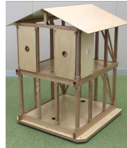
1階手前側耐震要素なし (平面・立面配置バランスの実験例)