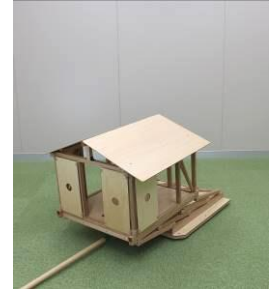
加振による1階部分崩壊