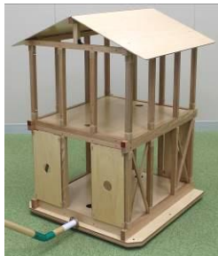
2階部分耐震要素なし (耐震要素の有無による実験例)