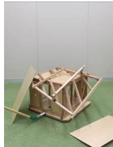
加振による2階部分崩壊